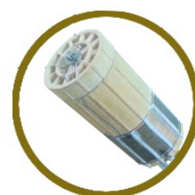
高精度發熱器溫度傳感器