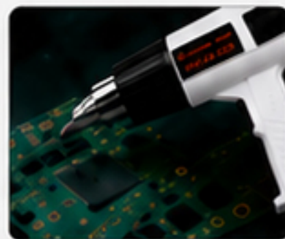
預熱 / 解焊鍋